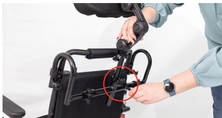
Figure 12 : Réglage de la hauteur

Les boutons-poussoirs noirs sous le coussin de tête permettent d'ajuster la hauteur, la profondeur et l'angle (voir fig. 13). Lors du réglage avec les boutons-poussoirs, veillez à ce qu'ils s'enclenchent complètement.