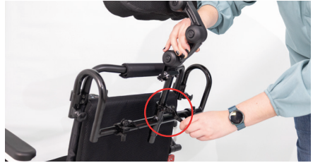
Abbildung 12: Einstellen der Höhe

Durch die schwarzen Druckknöpfe unterhalb der Kopfpolsterung können die Höhe, die Tiefe sowie der Winkel angepasst werden (s. Abb. 13). Bitte achte beim Verstellen an den Druckknöpfen darauf, dass diese wieder vollständig einrasten.