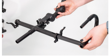
Figure 6 : Insertion des tubes incurvés

Insérez les tubes incurvés dans les petits tubes déjà montés (voir fig. 7). Les loquets en plastique doivent maintenant s'enclencher en les tournant, afin de relier les petits tubes aux tubes incurvés (voir fig. 8).