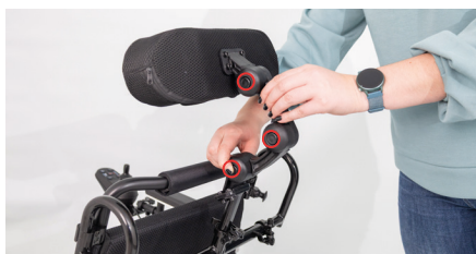
Figure 13 : Autres possibilités de réglage

Pour retirer rapidement l'appui-tête du fauteuil roulant, par exemple lors du chargement, les loquets en plastique doivent être desserrés en tirant et en tournant, puis les tubes incurvés peuvent être retirés en les soulevant. Ce procédé fonctionne également si vous maintenez les poignées de l'appui-tête et tirez avec deux doigts sur les leviers (voir fig. 14) pour retirer les tubes incurvés.