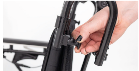
Figure 8 : Enclenchement des loquets en plastique

En déplaçant horizontalement, vous pouvez ajuster la position de départ de l'appui-tête (voir fig. 9). Vous pouvez maintenant serrer tous les colliers de fixation (voir fig. 10).