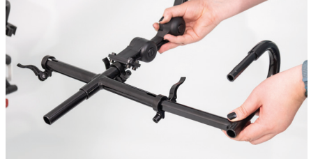
Abbildung 6: Einführen der gebogenen Rohrteile

Setze die gebogenen Rohre in die bereits montierten Rohrstücke ein (s. Abb. 7). Die Kunststoffhebel müssen nun durch Drehen eingerastet werden, um die kurzen Rohrstücke mit den gebogenen Rohrteilen zu verbinden (s. Abb. 8).