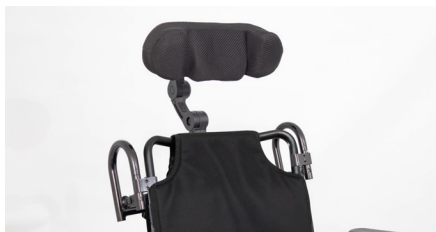
Figure 11 : Appui-tête monté

Votre appui-tête est maintenant monté (voir fig. 11) et peut être réglé individuellement selon vos besoins. L'appui-tête peut être réglé en hauteur en desserrant la pince sur le tube vertical, en réglant la hauteur souhaitée (réglage continu) (voir fig. 12), puis en resserrant la pince. Lors du transport, pensez à vérifier que tout est bien serré afin que l'appui-tête ne puisse pas glisser.