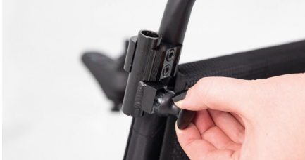
Abbildung 5: Entsperrn des Kunststoffriegels

Die Öffnung in den kurzen Rohrstücken muss beidseitig durch Ziehen und Drehen des Kunststoffriegels entsperrt werden (s. Abb. 5). Nimm anschließend die zwei gebogenen Rohrteile zur Hand (die nachher als Schiebegriff dienen) und schiebe diese in die seitlichen Öffnungen der Querstrebe (s. Abb. 6). Achte darauf, die Rohrklappen noch nicht anzuziehen, weil diese noch in der Breite verstellbar sein müssen.