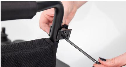
Abbildung 1: leichtes Festziehen der Rohrschelle

Beim ergoflix® heavy muss die Rohrschelle seitlich gerichtet an den Rollstuhlrahmen auf dem Stoffbezug angebracht werden (s. Abb. 2). Fahre mit der weiteren Anleitung fort.