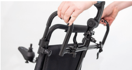
Abbildung 7: Einsetzen der Kopfstütze

Setze die gebogenen Rohre in die bereits montierten Rohrstücke ein (s. Abb. 7). Die Kunststoffhebel müssen nun durch Drehen eingerastet werden, um die kurzen Rohrstücke mit den gebogenen Rohrteilen zu verbinden (s. Abb. 8).