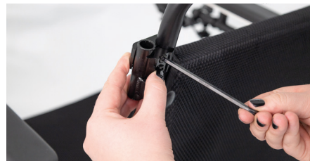
Abbildung 4: Festziehen der Rohrschelle