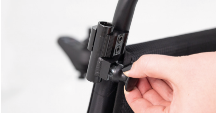
Figure 5 : Déverrouillage du loquet en plastique

L'ouverture dans les petits tubes doit être déverrouillée des deux côtés en tirant et en tournant le loquet en plastique (voir fig. 5). Prenez ensuite les deux tubes incurvés (qui serviront plus tard de poignées de poussée) et insérez-les dans les ouvertures latérales de la traverse (voir fig. 6). Veillez à ne pas encore serrer les colliers de fixation, car ils doivent pouvoir être ajustés en largeur.