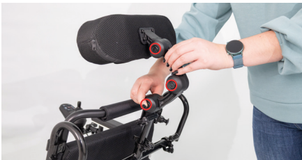
Abbildung 13: Weitere Einstellmöglichkeiten

Zur schnellen Entfernung der Kopfstütze vom Rollstuhl, z.B. beim Verladen, müssen die Kunststoffhebel durch Ziehen und Drehen gelöst und die gebogenen Rohre durch Anheben entfernt werden. Dieser Vorgang funktioniert auch, wenn Du die Schiebegriffe der Kopfstütze festhältst und dann mit zwei Fingern an den Hebeln ziehst (s. Abb. 14), um die gebogenen Rohre rauszuziehen.