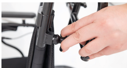
Figure 14 : Déverrouillage des loquets en plastique