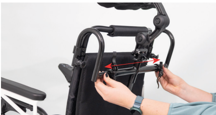
Abbildung 9: Verschieben der Kopfstütze

Durch Schieben in horizontaler Richtung kann die Ausgangsposition der Kopfstütze angepasst werden (s. Abb. 9). Ziehe nun alle Rohrklappen fest (s. Abb. 10).