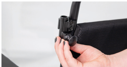
Abbildung 3: Einführen des kurzen Rohrstücks

Dann wird das kurze Rohrstück mit Kunststoffhebel jeweils so in die Öffnung der Schelle gesetzt, sodass der Kunststoffhebel nach hinten zeigt (s. Abb. 3). Ziehe nun die Schelle fest, damit das Rohrstück nicht mehr verrutschen kann (s. Abb. 4). Wiederhole diesen Schritt für die übrige Rahmenseite.