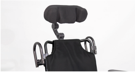
Abbildung 11: Fertig montierte Kopfstütze

Deine Kopfstütze ist nun fertig montiert (s. Abb. 11) und kann – je nach Bedarf – individuell eingestellt werden. Die Kopfstütze kann in der Höhe verstellt werden, indem man die Klemme am vertikal verlaufenden Rohr löst, die Wunschhöhe (stufenlos verstellbar) einstellt (s. Abb. 12) und die Klemme wieder anzieht. Bitte überprüfe, ob alles so festgezogen ist, dass die Kopfstütze während der Fahrt nicht verrutschen kann.