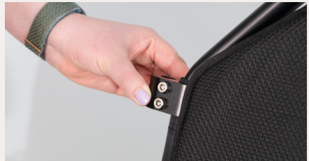
Abbildung 2: Montage Rohrschelle beim ergoflix® heavy

Dann wird das kurze Rohrstück mit Kunststoffhebel jeweils so in die Öffnung der Schelle gesetzt, sodass der Kunststoffhebel nach hinten zeigt (s. Abb. 3). Ziehe nun die Schelle fest, damit das Rohrstück nicht mehr verrutschen kann (s. Abb. 4). Wiederhole diesen Schritt für die übrige Rahmenseite.