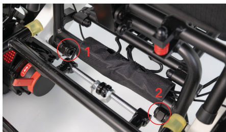
Figure 4 : Positionnement de la remorque

Lors du montage de la remorque, il existe un risque de pincement. Veuillez donc à travailler avec prudence.