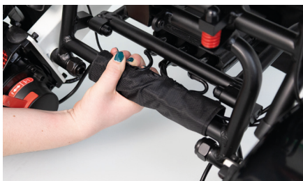
Figure 3 : Rotation du faisceau de câbles

Saisissez d'abord le faisceau de câbles si nécessaire et relevez légèrement le tissu afin de faciliter la fixation de la remorque (voir fig. 3). Placez ensuite la remorque contre le cadre du fauteuil roulant, directement entre les deux ouvertures des tubes ( 1-2 ) (voir fig. 4).