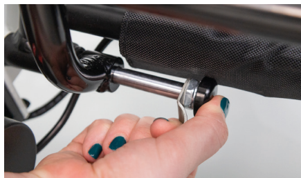
Figure 6 : Insertion des goupilles

La goupille argentée doit être complètement enfoncée dans le tube (voir fig. 7). Répétez la même opération de l'autre côté. La remorque pour fauteuil roulant est maintenant entièrement montée et peut être chargée (voir fig. 8).