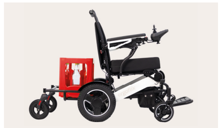
Abbildung 8: Fertig montierter Rollstuhl-Anhänger mit Getränkekiste

Bitte beachte, dass beim Rollstuhl-Anhänger das maximale Zuladungsgewicht 30 kg beträgt. Durch den Anhänger ist der Wendekreis des Rollstuhls vergrößert und Du benötigst eine umsichtigeren Fahrweise. Zuladungen sollten sicher angebracht und ggf. zusätzlich durch einen (Fahrrad-)Spanngurt gesichert werden, damit bei der Fahrt nichts herausfallen kann.