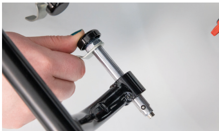
Figure 1 : Bouton-poussoir sur la goupille

Appuyez sur le bouton-poussoir noir situé sur la goupille argentée (voir fig. 1), puis tirez-la le plus possible sans la retirer complètement du tube. Répétez la même opération de l'autre côté, jusqu'à ce que les deux boutons-poussoirs se rejoignent (voir fig. 2).