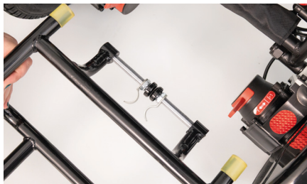
Figure 2 : Goupilles tirées vers l'extérieur

Saisissez d'abord le faisceau de câbles si nécessaire et relevez légèrement le tissu afin de faciliter la fixation de la remorque (voir fig. 3). Placez ensuite la remorque contre le cadre du fauteuil roulant, directement entre les deux ouvertures des tubes ( 1-2 ) (voir fig. 4).