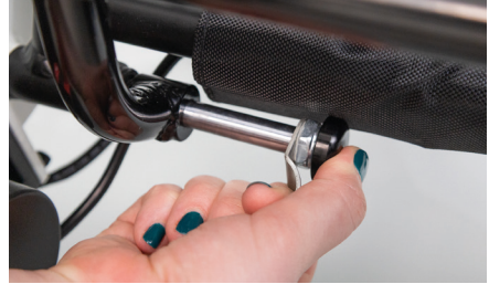
Abbildung 6: Einschieben der Bolzen

Der silberne Bolzen muss vollends in das Rohr gedrückt werden (s. Abb. 7), wiederhole dies auf der anderen Seite. Der Rollstuhl-Anhänger ist fertig montiert und kann beladen werden (s. Abb. 8).