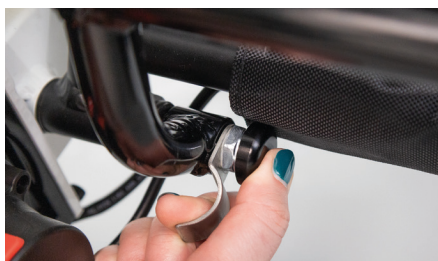
Figure 7 : Position finale de la goupille

La goupille argentée doit être complètement enfoncée dans le tube (voir fig. 7). Répétez la même opération de l'autre côté. La remorque pour fauteuil roulant est maintenant entièrement montée et peut être chargée (voir fig. 8).