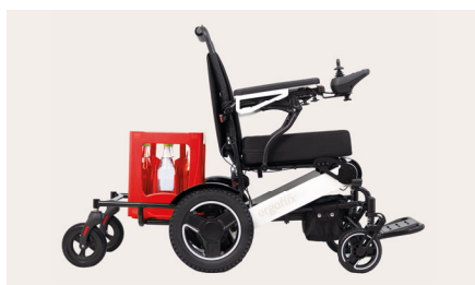
Figure 8 : Remorque pour fauteuil roulant entièrement montée avec une caisse de boissons

Veillez noter que la charge maximale autorisée pour la remorque de fauteuil roulant est de 30kg. L'utilisation de la remorque augmente le rayon de braquage du fauteuil roulant et nécessite donc une conduite plus prudente. Assurez-vous que le chargement soit correctement fixé et, si nécessaire, sécurisez-le en plus à l'aide d'une sangle de serrage (type sangle de vélo), afin d'éviter toute chute pendant le déplacement.