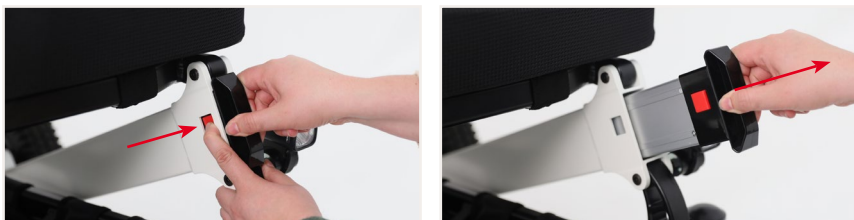
Abbildung 2: Entnehmen der Akkus anhand des Druckknopfes innen an der Akkufassung, um sie außerhalb des elektrischen Rollstuhls zu laden.

Alternativ kannst Du die Akkus auch entnehmen, um sie außerhalb des elektrischen Rollstuhls zu laden. Dazu betätigst Du einfach den Druckknopf innen an der Akkufassung.