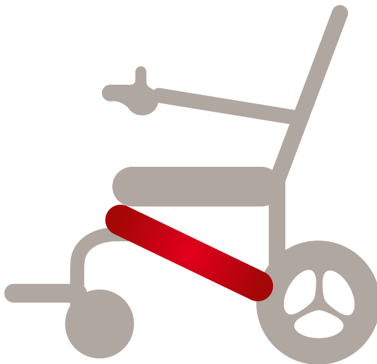
Position Akku ergoflix® heavy