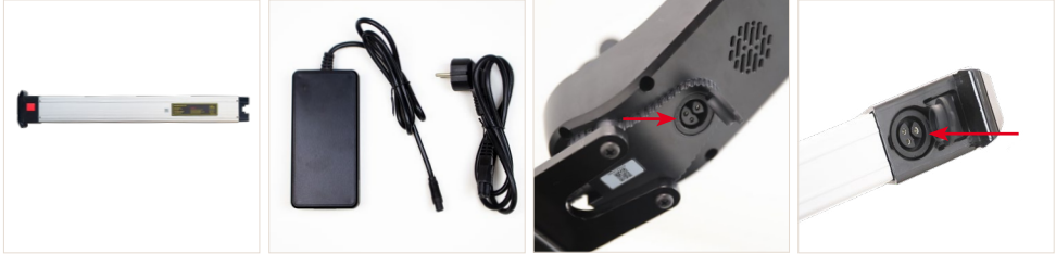
Abbildung 1: Akku des ergoflix®heavy und mit dem dazugehörigen Ladegerät und Anschlüssen