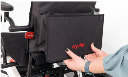
Abbildung 9: Zusammenfalten der Rollstuhltasche

Solltest Du die Tasche nicht benötigen, kann diese durch Greifen unter die Rollstuhltasche und Drücken gegen die Rückenlehne, wieder zusammengefasst werden (s. Abb. 9). Die in der Tasche integrierten Magnete halten sie in gefaltetem Zustand.