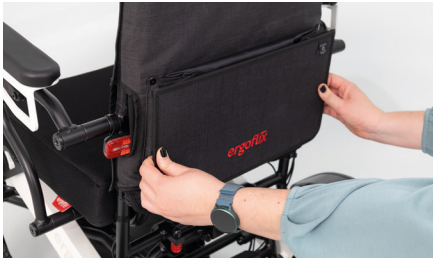
Abbildung 5: Greifen der Rollstuhltasche

Um die Rollstuhltasche zu nutzen, greife an die äußeren Seiten (s. Abb. 5) und ziehe die Tasche zu Dir hin, um sie auseinanderzufalten (s. Abb. 6).