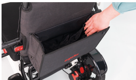
Figure 7 : Espace de rangement du sac pour fauteuil roulant

Le sac pour fauteuil roulant vous offre désormais un espace de rangement suffisant (voir fig. 7) et peut être fermé en toute sécurité à l'aide d'un cordon de serrage (voir fig. 8).