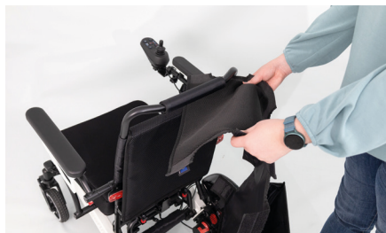
Figure 1 : Mise en place de la housse

Tirez ensuite la housse par-dessus le dossier jusqu'à ce que les découpes latérales soient correctement positionnées au niveau des articulations des accoudoirs (voir fig. 2).