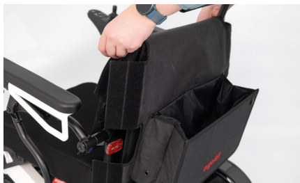
Figure 2 : Positionnement de la housse

Reliez la partie avant de la housse à la partie arrière des deux côtés à l'aide des fermetures auto-agrippantes latérales (voir fig. 3). Veillez à fermer la housse en haut et en bas (voir fig. 4). Vérifiez ensuite la visibilité de votre feu arrière en vous assurant qu'il n'est pas masqué par la housse.