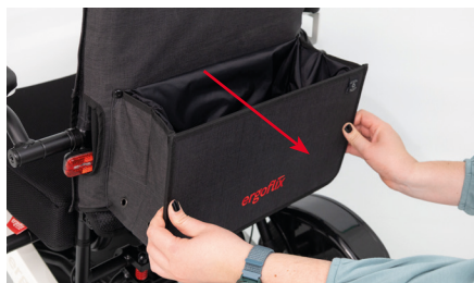
Figure 6 : Dépliage du sac pour fauteuil roulant

Le sac pour fauteuil roulant vous offre désormais un espace de rangement suffisant (voir fig. 7) et peut être fermé en toute sécurité à l'aide d'un cordon de serrage (voir fig. 8).