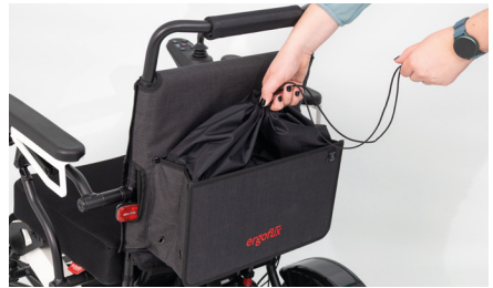
Abbildung 8: Zuschnüren der Tasche

Solltest Du die Tasche nicht benötigen, kann diese durch Greifen unter die Rollstuhltasche und Drücken gegen die Rückenlehne, wieder zusammengefasst werden (s. Abb. 9). Die in der Tasche integrierten Magnete halten sie in gefaltetem Zustand.