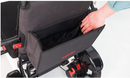
Abbildung 7: Stauraum der Rollstuhltasche

Die Rollstuhltasche bietet Dir nun genügend Stauraum (s. Abb. 7) und lässt sich mithilfe eines Kordelzugs sicher verschließen (s. Abb. 8).