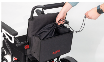
Figure 8 : Fermeture du sac par cordon de serrage

Si vous n'avez pas besoin du sac, vous pouvez le replier en saisissant la partie inférieure du sac pour fauteuil roulant et en le poussant contre le dossier (voir fig. 9). Les aimants intégrés dans le sac le maintiennent en position repliée.