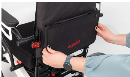
Figure 5 : Saisie du sac pour fauteuil roulant

Pour utiliser le sac pour fauteuil roulant, saisissez les côtés extérieurs (voir fig. 5) et tirez le sac vers vous afin de le déplier (voir fig. 6).