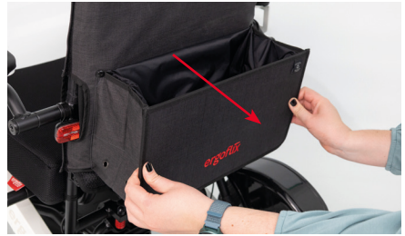
Abbildung 6: Auseinanderfalten der Rollstuhltasche

Die Rollstuhltasche bietet Dir nun genügend Stauraum (s. Abb. 7) und lässt sich mithilfe eines Kordelzugs sicher verschließen (s. Abb. 8).