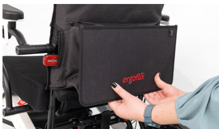
Figure 9 : Pliage du sac pour fauteuil roulant

Si vous n'avez pas besoin du sac, vous pouvez le replier en saisissant la partie inférieure du sac pour fauteuil roulant et en le poussant contre le dossier (voir fig. 9). Les aimants intégrés dans le sac le maintiennent en position repliée.