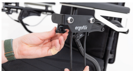
Abbildung 3: Drehen des Rädchens der Feststellschraube

Drehe am Rädchen, um die Feststellschraube wieder festzuziehen und den Taschenhalter zu fixieren (s. Abb. 3).