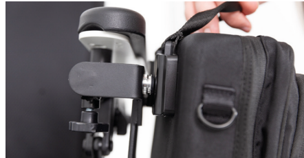
Abbildung 5: Entfernen der Rollstuhltasche

Gut zu wissen: Mit der kleinen Rollstuhltasche wird auch ein langer Tragegurt mitgeliefert. Diesen kannst Du mit Hilfe der Haken an der Tasche befestigen und die Länge entsprechend einstellen.