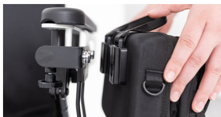
Figure 4 : alignement du sac pour fauteuil roulant au support

Pour retirer le petit sac pour fauteuil roulant, tirez sur la languette en tissu, de manière à séparer les aimants (voir Fig. 5). Notez que le languette en tissu est uniquement destinée à attacher et détacher le sac. Elle ne doit pas être utilisée comme poignée de transport.