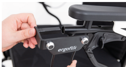
Abbildung 2: Verbinden des Taschenhalters mit dem Rundrohr

Drehe am Rädchen, um die Feststellschraube wieder festzuziehen und den Taschenhalter zu fixieren (s. Abb. 3).