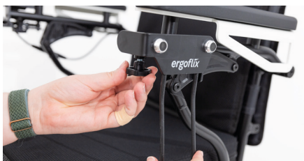
Figure 3 : rotation de la molette de la vis de blocage

Tournez la molette pour serrer à nouveau la vis de blocage et fixer le porte-sac (voir Fig. 3).