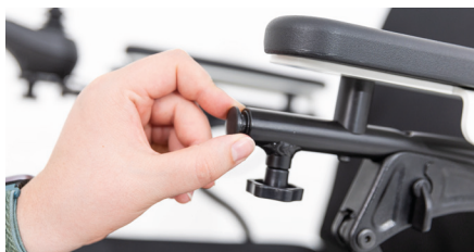
Abbildung 1: Entfernen der Abdeckung

Löse die Feststellschraube unter der Armlehne und entferne die schwarze runde Abdeckung (s. Abb. 1). Schiebe das Vierkantstück des Taschenhalters in das Rundrohr Deines Elektrorollstuhls (s. Abb. 2). Achte darauf, dass der Bügel des Taschenhalters nach unten zeigt.