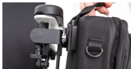
Figure 5 : retrait du petit sac pour fauteuil roulant

Bon à savoir : Une longue sangle de transport est également incluse avec le petit sac pour fauteuil roulant. Vous pouvez l'attacher au sac à l'aide des crochets et ajuster la longueur à votre convenance.