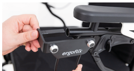
Figure 2 : connexion du porte-sac au tube rond

Tournez la molette pour serrer à nouveau la vis de blocage et fixer le porte-sac (voir Fig. 3).