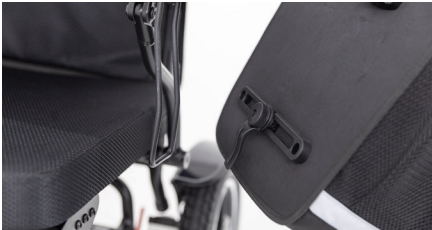
Abbildung 6: Einhaken der großen Rollstuhltasche

Um die große Rollstuhltasche wieder zu entfernen, ziehe an der Stoffflasche (s. Abb. 7). Nutze den mittigen Tragegriff, um die Tasche zu transportieren. Die Stoffflasche dient lediglich dazu, die Tasche von dem Elektrorollstuhl zu entfernen.