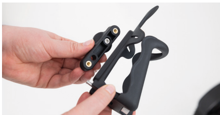
Figure 5 : Positionnement du porte-bouteille

Placez le porte-bouteille avec son dos contre le support (voir Fig. 5). Assurez-vous que les trous (1-3) restent visibles à travers l'encoche (voir Fig. 6).