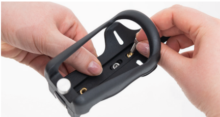
Abbildung 7: Einsetzen der Schrauben

Setze die beiden kleinen Schrauben in die Löcher ein (s. Abb. 7) und ziehe diese fest, um den Flaschenhalter zu fixieren (s. Abb. 8). Der Flaschenhalter kann nun an die Schelle am Rollstuhlrahmen angebracht werden.