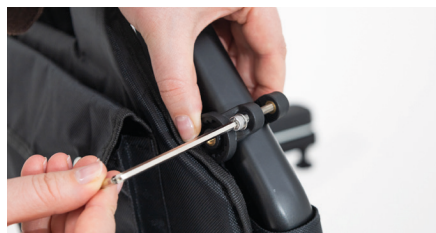
Figure 2 : Serrage des vis

Veillez à serrer les vis de manière alternée pour éviter tout désalignement. Serrez les vis fermement afin que la bride ne glisse plus (voir Fig. 3). Prenez le support et insérez la vis de taille moyenne dans l'ouverture prévue (voir Fig. 4). La vis doit rester libre dans l'ouverture.