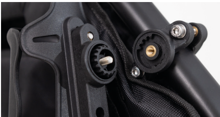
Abbildung 9: Rastnasen

Achte beim Ansetzen auf die Rastnasen der Halterung und der angebrachten Schelle (s. Abb. 9). Richte den Flaschenhalter möglichst senkrecht aus und ziehe die Schraube in der Mitte fest, um den Flaschenhalter zu montieren (s. Abb. 10).