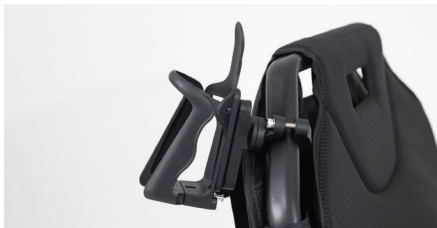
Abbildung 11: Fertig montierter Flaschenhalter

Der Flaschenhalter ist nun einsatzbereit (s. Abb. 11). Mithilfe eines Druckknopfs am Boden kann der Durchmesser des Flaschenhalters vergrößert oder verkleinert werden. Drücke dafür auf den Knopf und ziehe gleichzeitig an der vorderen Hälfte des Flaschenhalters (s. Abb. 12).