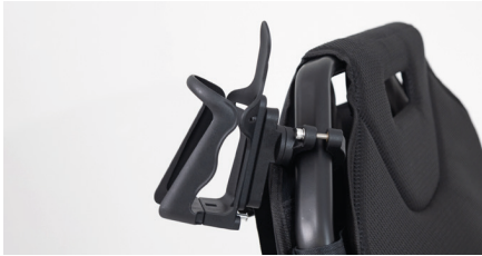
Figure 11 : Porte-bouteille monté

Le porte-bouteille est maintenant prêt à l'emploi (voir Fig. 11). Grâce à un bouton-poussoir situé sur la partie basse, la largeur du porte-bouteille peut être agrandie ou réduite. Pour ce faire, appuyez sur le bouton et tirez simultanément sur la partie avant du porte-bouteille (voir Fig. 12).