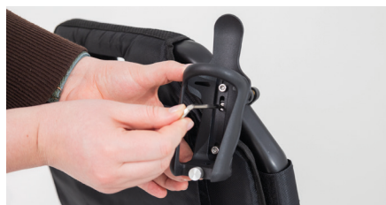
Figure 10 : Montage du porte-bouteille