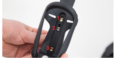
Abbildung 6: Schraublöcher

Setze die beiden kleinen Schrauben in die Löcher ein (s. Abb. 7) und ziehe diese fest, um den Flaschenhalter zu fixieren (s. Abb. 8). Der Flaschenhalter kann nun an die Schelle am Rollstuhlrahmen angebracht werden.