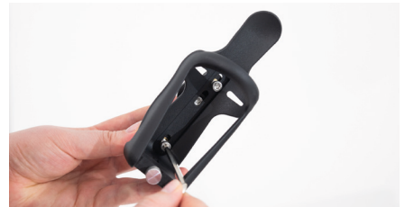
Abbildung 8: Festziehen der Schrauben

Achte beim Ansetzen auf die Rastnasen der Halterung und der angebrachten Schelle (s. Abb. 9). Richte den Flaschenhalter möglichst senkrecht aus und ziehe die Schraube in der Mitte fest, um den Flaschenhalter zu montieren (s. Abb. 10).