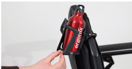
Abbildung 13: Drehen am Rädchen

Um Feinjustierungen vorzunehmen, kannst Du am silbernen Rädchen drehen. So kannst Du ebenfalls den Durchmesser des Flaschenhalters anpassen (s. Abb. 13). Die Flasche sitzt nun fest im Flaschenhalter (s. Abb. 14).