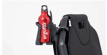
Figure 14: Bouteille correctement installée