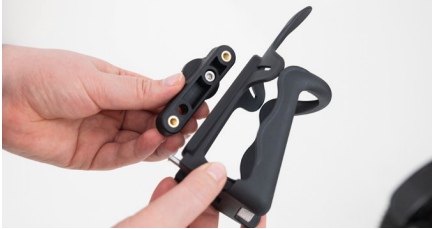
Abbildung 5: Ansetzen des Flaschenhalters

Setze den Flaschenhalter mit der Rückseite an die Halterung an (s. Abb. 5). Achte darauf, dass die Löcher (1-3) durch die Aussparungen sichtbar bleiben (s. Abb. 6).