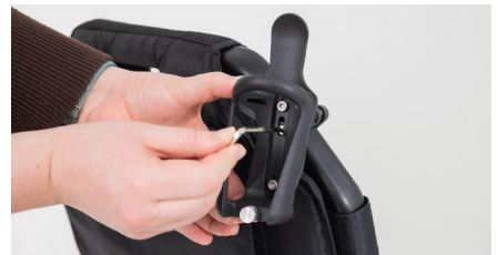
Abbildung 10: Montage des Flaschenhalters