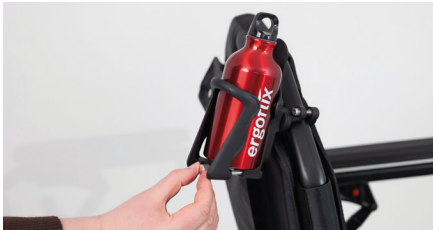
Figure 13: Rotation de la molette

Pour effectuer des ajustements fins, vous pouvez tourner la molette argentée. Cela vous permet également d'ajuster la largeur du porte-bouteille (voir Fig. 13). La bouteille est maintenant solidement fixée dans le porte-bouteille (voir Fig. 14).