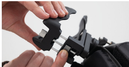
Abbildung 12: Einstellen des Durchmessers

Um Feinjustierungen vorzunehmen, kannst Du am silbernen Rädchen drehen. So kannst Du ebenfalls den Durchmesser des Flaschenhalters anpassen (s. Abb. 13). Die Flasche sitzt nun fest im Flaschenhalter (s. Abb. 14).