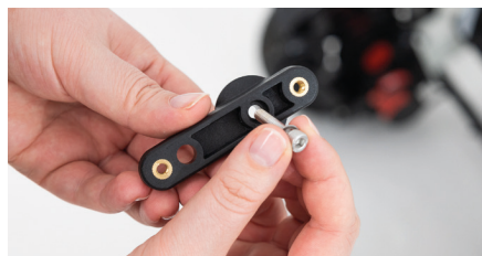
Figure 4 : Insertion de la vis