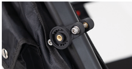
Abbildung 3: Festgezogene Schelle

Achte darauf, die Schrauben abwechselnd festzuziehen, um ein Verkanten zu vermeiden. Ziehe die Schrauben fest, sodass die Schelle nicht mehr verrutscht (s. Abb. 3). Nimm die Halterung zur Hand und setze die einzelne mittelgroße Schraube in die Öffnung ein (s. Abb. 4). Die Schraube liegt lose in der Öffnung.