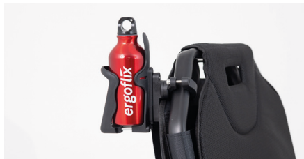
Abbildung 14: Fertig eingesetzte Flasche