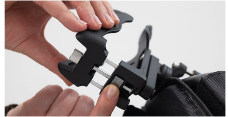
Figure 12 : Réglage de la largeur

Pour effectuer des ajustements fins, vous pouvez tourner la molette argentée. Cela vous permet également d'ajuster la largeur du porte-bouteille (voir Fig. 13). La bouteille est maintenant solidement fixée dans le porte-bouteille (voir Fig. 14).