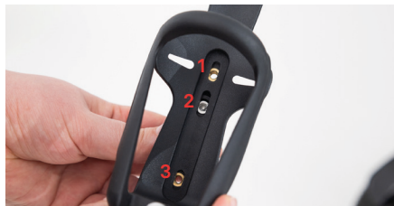
Figure 6 : Trous de vis

Insérez les deux petites vis dans les trous (voir Fig. 7) et serrez-les pour fixer le porte-bouteille (voir Fig. 8). Le porte-bouteille peut maintenant être attaché à la bride sur le cadre du fauteuil roulant.