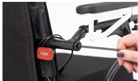
Abbildung 8: Festziehen der Schraube

Wiederhole den Vorgang für die übrige Seite und montiere im Anschluss wieder beide Kabel sowie den Lichtdruckknopf am Rollstuhl. Die Sitzbreite des Rollstuhls wurde erweitert (s. Abb. 9).