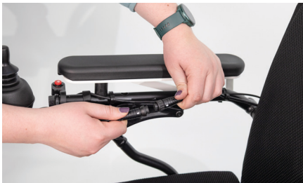
Figure 1 : Débranchement du câble

Commencez par retirer le module de commande existant en desserrant la molette sur la pièce de connexion, puis en débranchant les connecteurs (voir fig. 1). Retirez ensuite les deux bandes velcro qui maintiennent le câble d'éclairage ( 1-2 ), puis sortez le câble du module de commande des crochets ( 3-4 ) (voir fig. 2).