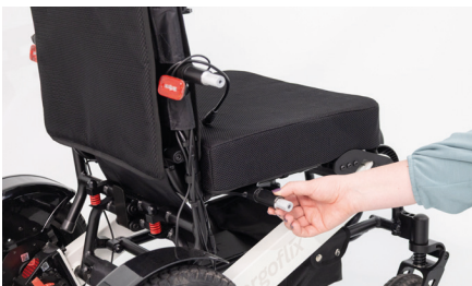
Abbildung 7: Anbringen der Hülsen

Stecke nun die lange Hülse auf die Halterung an der Rückenlehne und die kurze Hülse auf die Halterung am Sitz (s. Abb. 7). Anschließend wird die Armlehne auf beide Halterungen gesetzt und mit den mitgelieferten, längeren Schrauben montiert (s. Abb. 8). Achte darauf, die Schrauben nur so festzuziehen, dass ein Abschwenken der Armlehnen nach oben und damit ein seitlicher Einstieg in Deinen Rollstuhl weiterhin möglich ist.