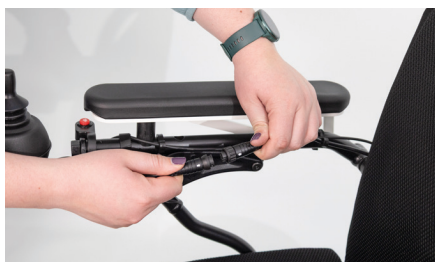
Abbildung 1: Trennen des Kabels

Entferne zunächst das vorhandene Bedienmodul, indem Du das Rädchen am Verbindungsstück lockerst und die Stecker auseinanderziehst (s. Abb. 1). Entferne die beiden Klettbander vom Lichtkabel ( 1-2 ) und nimm das Bedienmodulkabel aus den Haken ( 3-4 ) heraus (s. Abb. 2).