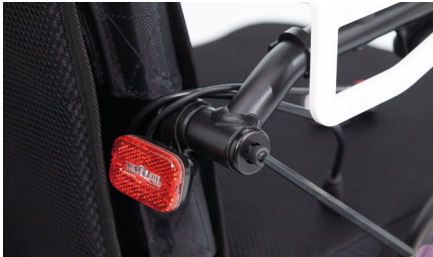
Abbildung 5: Lösen der Schrauben

Verwende nun den Inbusschlüssel der Größe 5, um die beiden Schrauben der Armlehne zu lösen (s. Abb. 5) und ziehe anschließend die gelöste Armlehne zu Dir. Achte darauf, dass die beiden schwarzen Lager am Sitz montiert bleiben (s. Abb. 6).