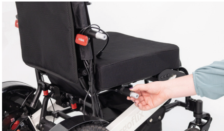
Figure 7 : Pose des douilles

Placez maintenant la longue douille sur le support du dossier et la courte douille sur le support de l'assise (voir fig. 7). Ensuite, positionnez l'accoudoir sur les deux supports et fixez-le à l'aide des vis plus longues fournies (voir fig. 8). Veillez à ne pas trop serrer les vis afin de permettre à l'accoudoir de pivoter vers le haut. Cela garantit un accès latéral à votre fauteuil roulant.