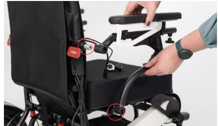
Abbildung 6: Gelöste Armlehne

Stecke nun die lange Hülse auf die Halterung an der Rückenlehne und die kurze Hülse auf die Halterung am Sitz (s. Abb. 7). Anschließend wird die Armlehne auf beide Halterungen gesetzt und mit den mitgelieferten, längeren Schrauben montiert (s. Abb. 8). Achte darauf, die Schrauben nur so festzuziehen, dass ein Abschwenken der Armlehnen nach oben und damit ein seitlicher Einstieg in Deinen Rollstuhl weiterhin möglich ist.