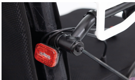
Figure 5 : Desserrage des vis

Utilisez maintenant la clé Allen de taille 5 pour desserrer les deux vis de l'accoudoir (voir fig. 5), puis tirez l'accoudoir ainsi libéré vers vous. Veillez à ce que les deux supports noirs restent bien fixés sur l'assise (voir fig. 6).