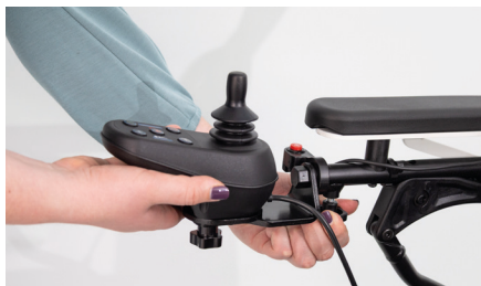
Abbildung 3: Entfernen des Bedienmoduls

Löse die Feststellschraube, um das Bedienmodul zu entfernen (s. Abb. 3). Schraube – sofern vorhanden – den separat angebrachten Lichtdruckknopf mit Hilfe des Inbusschlüssels in Größe 3 ab (s. Abb. 4) und lege diesen auf der Sitzfläche ab.