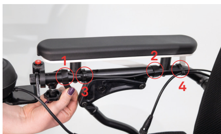
Abbildung 2: Lösen der Kabel

Löse die Feststellschraube, um das Bedienmodul zu entfernen (s. Abb. 3). Schraube – sofern vorhanden – den separat angebrachten Lichtdruckknopf mit Hilfe des Inbusschlüssels in Größe 3 ab (s. Abb. 4) und lege diesen auf der Sitzfläche ab.