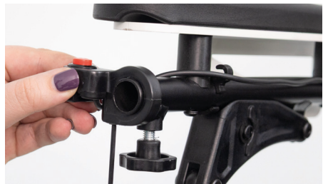
Figure 4 : Démontage du bouton d'éclairage