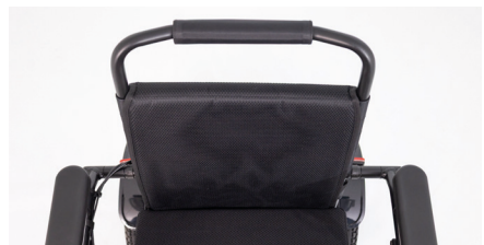
Abbildung 9: Fertig montierte Sitzbreitenerweiterung

Wiederhole den Vorgang für die übrige Seite und montiere im Anschluss wieder beide Kabel sowie den Lichtdruckknopf am Rollstuhl. Die Sitzbreite des Rollstuhls wurde erweitert (s. Abb. 9).