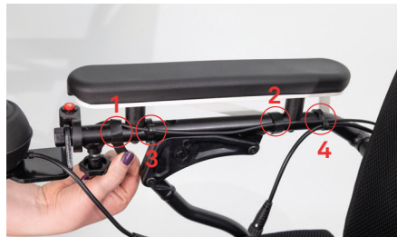
Figure 2 : Libération des câbles

Desserez la vis de fixation afin de retirer le module de commande (voir fig. 3). Si votre fauteuil est équipé d'un bouton de commande d'éclairage monté séparément, dévissez-le à l'aide d'une clé Allen de taille 3 (voir fig. 4) et posez-le ensuite sur l'assise.