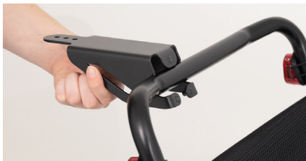
Figure 3 : Mise en place du support

Positionnez le support sur la poignée de poussée (Cf. figure 3). Ensuite, montez à nouveau la plaque sur le support à l'aide des vis (Cf. figure 4) en s'assurant d'un serrage optimal. Vérifiez que l'ensemble soit suffisamment serré sur la poignée de poussée.