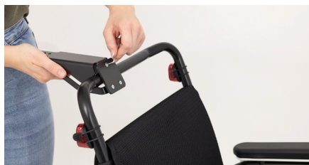
Abbildung 4: Festdrehen der Schrauben