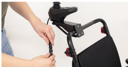
Abbildung 7: Verbinden des Kabels

Verbinde danach die beiden Stecker mit der Pfeilmarkierung zueinander und drehe anschließend am Rädchen (s. Abb. 7). Der Bedienmodul-Adapter für Begleitpersonen ist nun fertig montiert (s. Abb. 8).