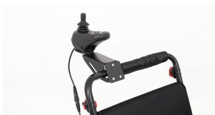
Figure 8 : Vue d'ensemble monté