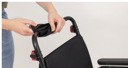
Abbildung 1: Entfernen des Polsters

Entferne zunächst das vorhandene Polster vom Schiebebügel (s. Abb. 1) und bereite den Adapter vor, indem Du die Platte mithilfe des Inbusschlüssels vom Adapter löst (s. Abb. 2).