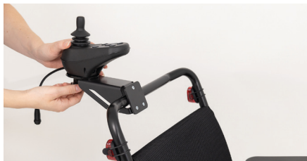
Figure 5 : Montage du boîtier de commande

Montez le boîtier de commande sur son nouveau support à l'aide des vis de serrage (Cf. figure 5). Puis, assurez-vous du passage du câblage convenable à l'aide des divers anneaux de maintien de câble, se trouvant tout le long du fauteuil roulant (Cf. figure 6).