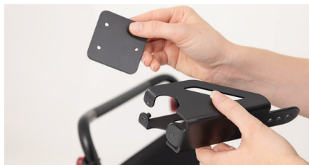
Figure 2 : Séparation des éléments

Positionnez le support sur la poignée de poussée (Cf. figure 3). Ensuite, montez à nouveau la plaque sur le support à l'aide des vis (Cf. figure 4) en s'assurant d'un serrage optimal. Vérifiez que l'ensemble soit suffisamment serré sur la poignée de poussée.