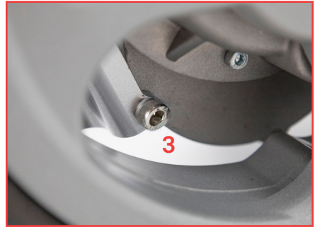
Abbildung 2: Schraube an Innenseite (3)

Setzen Sie den Kippschutz für die rechte Seite auf die Schraublöcher (s. Abbildung 3). Führen Sie in das obere Schraubloch anstelle der zuvor demon- tierten Schraube nun die mitgelieferte lange Schraube ein und ziehen diese mit Hilfe des Inbusschlüssels an (s. Abbildung 4).