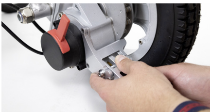
Abbildung 3: Aufsetzen des Kippschutzes

Setzen Sie den Kippschutz für die rechte Seite auf die Schraublöcher (s. Abbildung 3). Führen Sie in das obere Schraubloch anstelle der zuvor demon- tierten Schraube nun die mitgelieferte lange Schraube ein und ziehen diese mit Hilfe des Inbusschlüssels an (s. Abbildung 4).