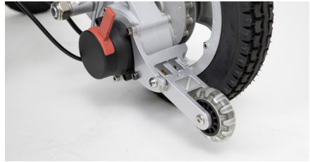
Abbildung 6: Fertig montierter Kippschutz

Wiederholen Sie den kompletten Vorgang anschließend für die übrige Seite.