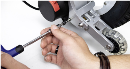
Abbildung 5: Anziehen der unteren Schraube

Nun setzen Sie die beiden mitgelieferten kurzen Schrauben in die unteren Schraublöcher ein und drehen diese mit dem Inbusschlüssel ebenfalls fest (s. Abbildung 5).